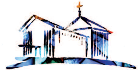
Bischöfl. Priesterseminar St. German Pastoralseminar des Bistums Speyer

Nördlich vom Stadt-Zentrum befindet sich der Speyerer Bahnhof. Von dort nimmt man die Buslinie 564 bis zur Haltestelle »Am Germansberg«. Fahrplan-Auskünfte unter www.vrn.de